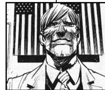
La société Ophis