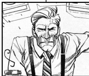
Les médias et spectateurs